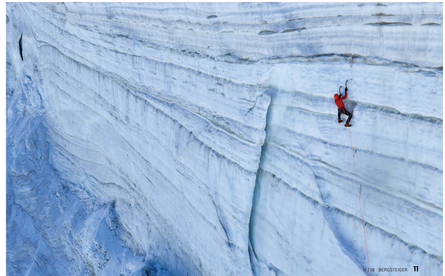
▼ Klare Linien Die Diretissima im Blick: Ueli Steck im Sérac-Abbruch beim Jungfrauojch, Berner Alpen