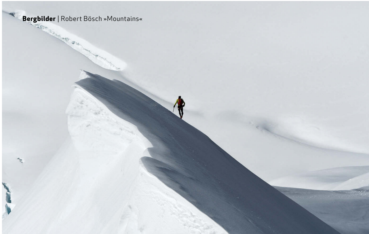
▲ Wächtentanz Die Einsamkeit des Bergsteigers: Ueli Steck traversiert im Südlichen Eigerjoch, Berner Alpen.