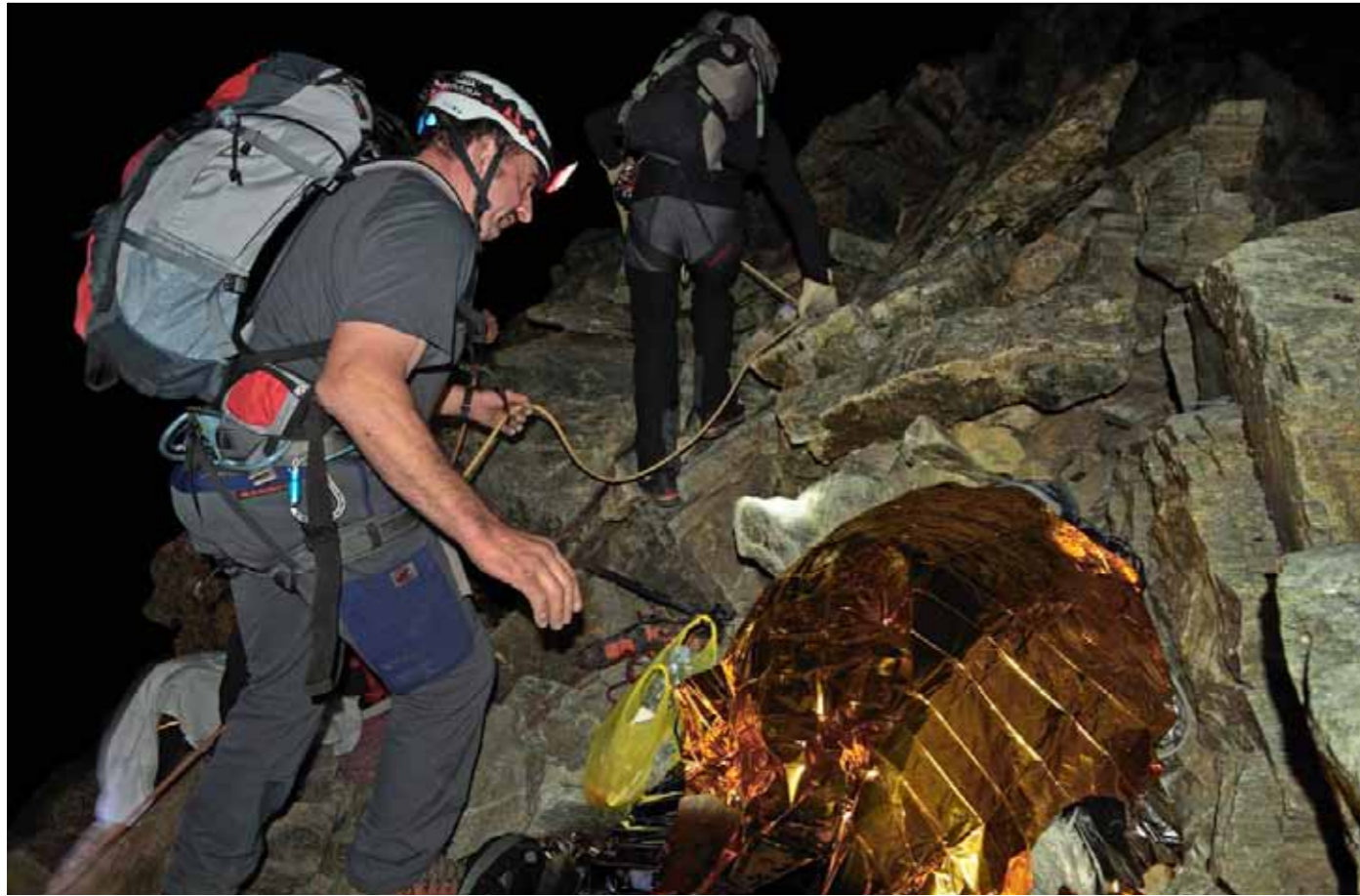
Die ersten Bergsteiger passieren zwei vom Vortag, die den Abstieg nicht geschafft haben und unter einer Rettungsfolie biwakieren

4003 Meter erreicht hat. Die Notunterkunft befindet sich auf der Hälfte des Aufstiegswegs. Und weil am Matterhorn für den Abstieg ebenso viel Zeit wie für den Aufstieg eingerechnet werden muss, hat man dort erst ein Viertel der ganzen Tour zurückgelegt.