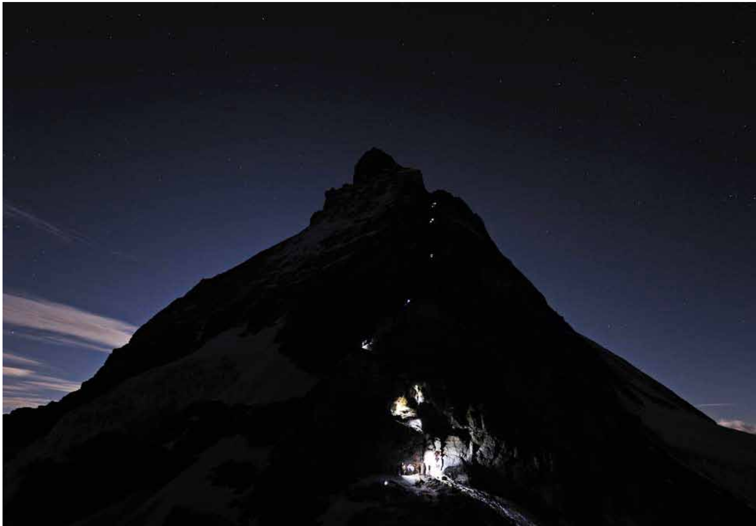
Das Matterhorn am frühen Morgen. Die unteren Lichter gehören aufsteigenden Alpinisten, die oberen Lampen Seilschaften beim Abstieg

Von Daniel Foppa (TEXT)