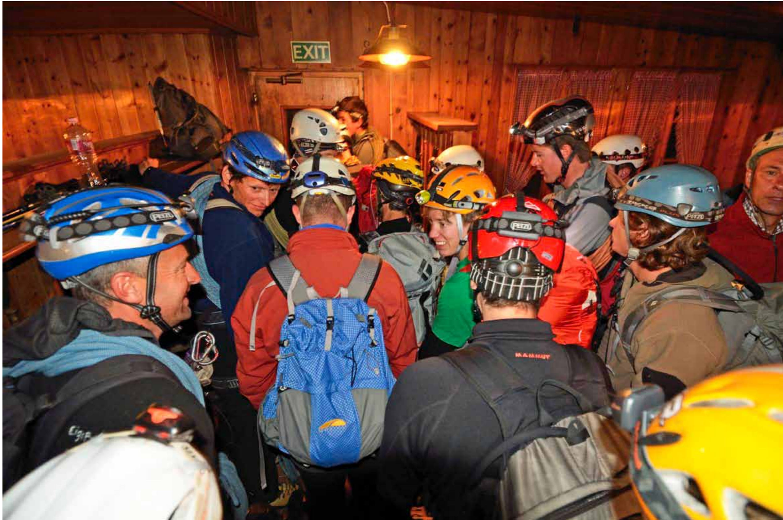
Frühmorgens um 4.15 Uhr. Angeseilt, den Helm mit Lampe aufgesetzt, warten die Seilschaften an der Schwelle zum Abenteuer. Dieses strenge Abmarsch-Regime gibt es nur am Matterhorn

Jahre, bis ich mich durchgerungen hatte. Ein extremer Bauchentscheid.“